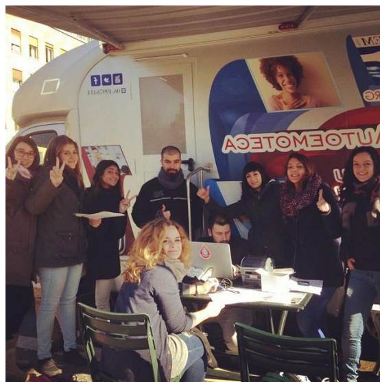
Il nostro personale delle raccolte esterne

Gli aspiranti donatori sono invitati a compilare un questionario sul proprio stato di salute. Segue una visita medica approfondita e, se le condizioni di salute del donatore rientrano nei parametri stabiliti dal Ministero della Salute (D.L. 02/22/2015 Min. Salute – G.U. del 28/12/2015), si potrà effettuare la donazione del sangue sull'autoemoteca (si possono effettuare 3 donazioni contemporaneamente su ciascuna delle autoemoteche dell'Associazione). A conclusione della donazione, offriamo al donatore una ricca colazione (caffè, latte, acqua, lieviti freschi), come previsto dalle direttive ministeriali sopracitate.