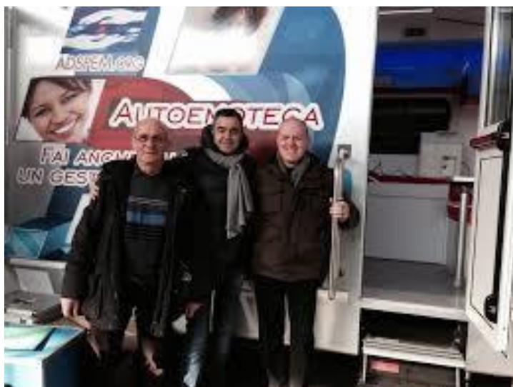
Il Coordinatore infermieristico, il Direttore Generale e il Direttore Sanitario Ad Spem

A fronte di una richiesta specifica, quando è prevista una grande affluenza di donatori, il personale medico può essere implementato ulteriormente.